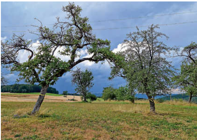
Das Ernteprojekt „Gelbes Band“ setzt sich für einen achtsamen Umgang mit Lebensmitteln ein.

Dabei gilt: Geerntet wird in haushaltsüblichen Mengen und eigenverantwortlich. Wer pflückt, agiert auf eigene Gefahr und ist somit für die eigene Sicherheit, beispielsweise beim Besteigen von Leitern, selbst verantwortlich. An Straßen muss besondere Rücksicht auf den Verkehr genommen werden, um sich selbst und andere nicht zu gefährden oder zu verletzen. Dass Gelbe-Band-Bäume nicht beschädigt und dass Grundstücke nach der Ernte wieder ordentlich verlassen werden, versteht sich von selbst.