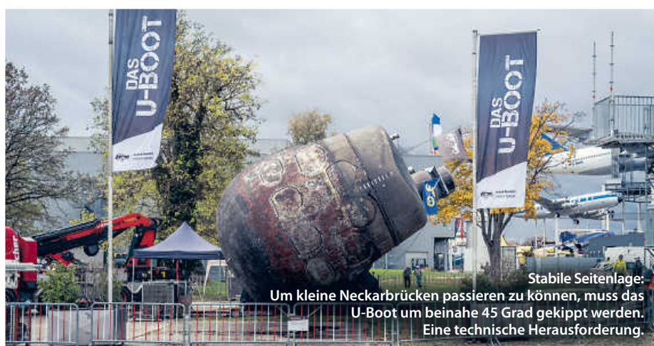
Stabile Seitenlage: Um kleine Neckarbrücken passieren zu können, muss das U-Boot um beinahe 45 Grad gekippt werden. Eine technische Herausforderung.

Insgesamt investierte der Verein Auto-Technik-Museum rund 2 Millionen Euro in das Projekt. Doch das, so Einkörn, habe sich gelohnt. (ral)